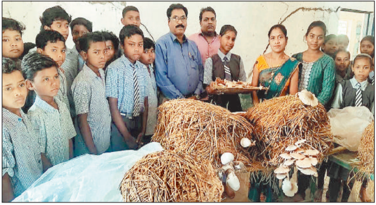
मशरूम की जानकारी देते स्कूली बच्चे।

आज के समय में सरकारी नौकरी पाना आसान नहीं है। इसीलिए मशरूम उत्पादन जैसे स्वरोजगार भविष्य के लिए बेहतर विकल्प साबित हो सकते हैं। इससे घर बैठे अच्छी आय अर्जित की जा सकती है। शासन द्वारा चलाए जा रहे छात्र-छात्राओं के लिए व्यावसायिक शिक्षा वास्तव में आज की मांग है। यह एक अभियान रूप में चलाया जा रहा है, ग्राम पंचायत नदीगांव में व्यवसायिक शिक्षा अध्ययन सफलतापूर्वक संपन्न हुआ। शासकीय मिडिल स्कूल नदीगांव में कक्षा छठवीं से आठवीं के 38 बच्चों ने व्यवसायिक शिक्षा के तहत मशरूम उत्पादन को चुना और यहाँ प्रशिक्षित किसान के द्वारा स्कूल परिसर में बच्चों को मशरूम उत्पादन का प्रशिक्षण दिया गया। जहाँ सभी बच्चों ने उत्साह के साथ मशरूम उत्पादन की शिक्षा ग्रहण किया और अपने हाथों से मशरूम